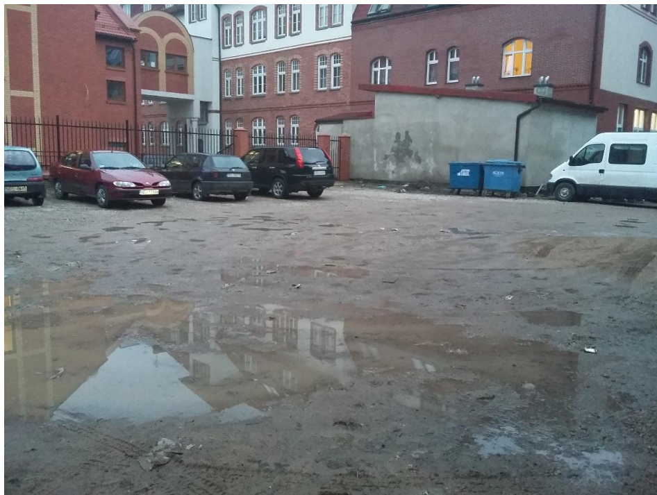
Podwórko pełniące funkcję parkingu, w tle zabudowania seminarium