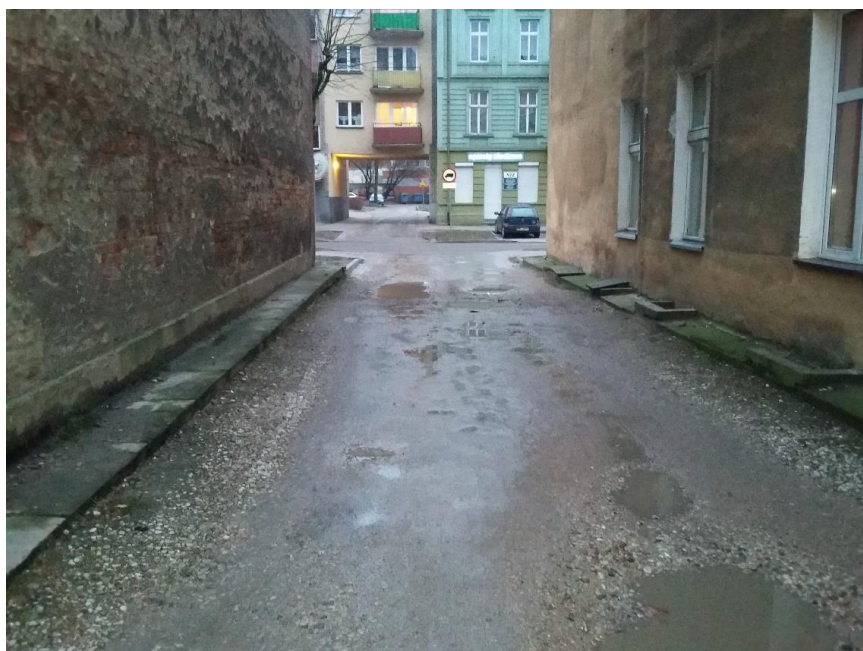
Wyjazd z podwórka w kierunku ul. Chopina