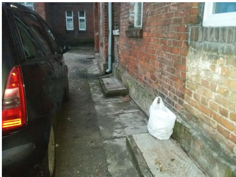
Dojścia do piwnic

Projekt zagospodarowania przestrzennego zakłada ułożenie chodników wzdłuż budynków, należy przy tym uwzględnić, że są tam zlokalizowane otwory do piwnic.