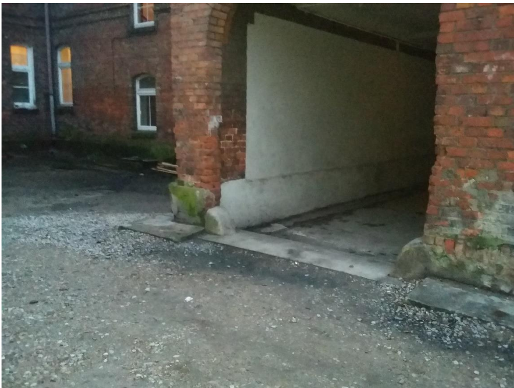
Teren przed bramą wejściową na podwórko.