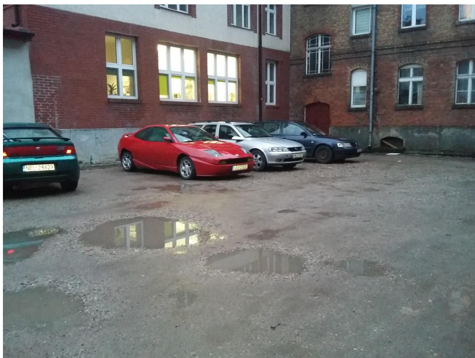
Podwórko pełniące funkcję parkingu, w tle zabudowania seminarium oraz budynek ul. Kościuszki