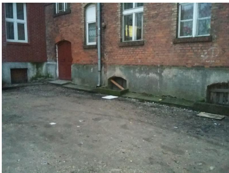
Dojścia do piwnic