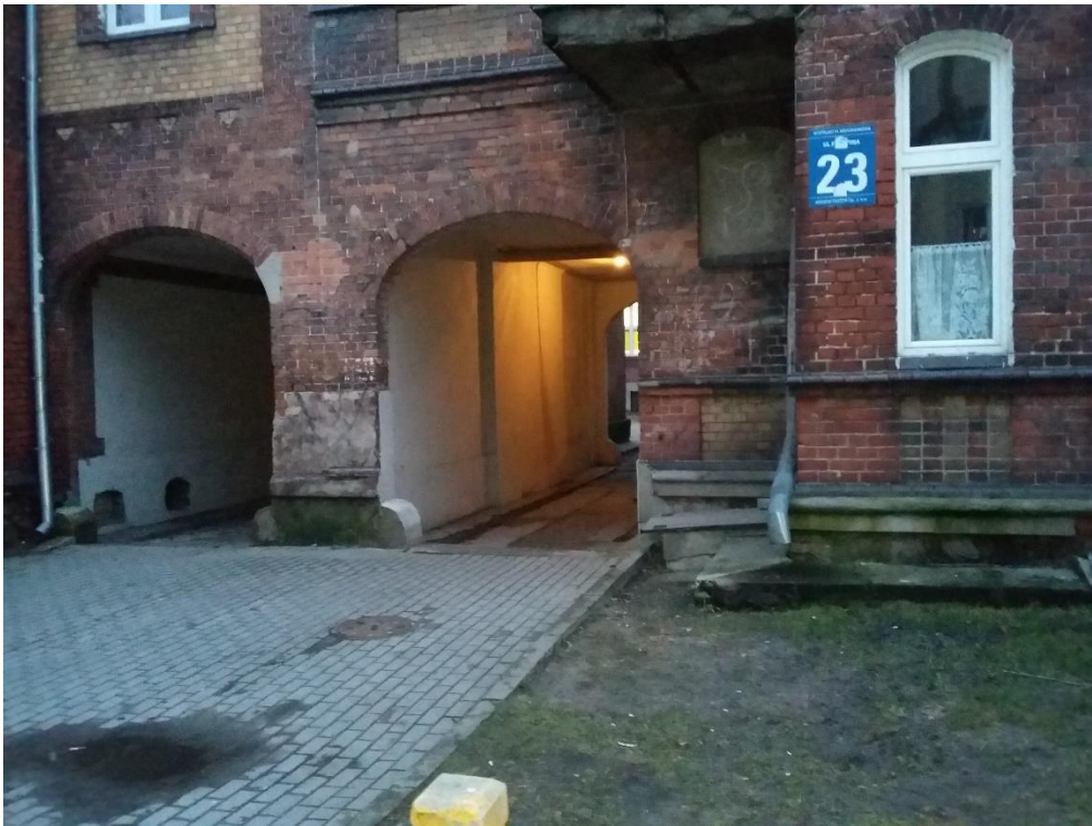
Przejścia bramowe na podwórko i do budynków mieszkalnych